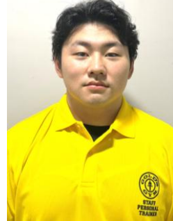
薄井トレーナー ¥3,300円(税込)