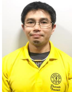
佐藤トレーナー ¥2,750円(税込)