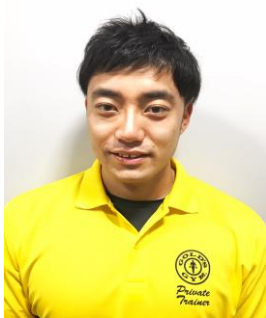
穂積トレーナー ¥3,300円(税込)